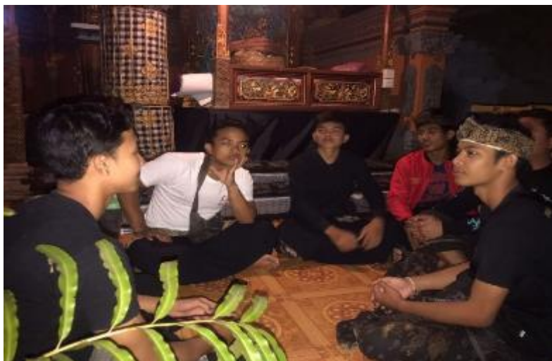
Gambar 2 kegiatan membrikan pemahaman (Dok I Dewa Ketut Manik Kedaton Juni 2023)

penabuh disaat mengajar atau penuangan tabuh. Dengan adanya interaksi yang baik hal-hal seperti yang sudah dijelaskan tersebut akan menimbulkan kesan yang santai akan tetapi tetap mengedepankan keseriusan dalam pelaksanaan pelatihan program kerja. Adapun juga hal yang membuat interaksi sesama penabuh semakin baik yaitu dengan cara melakukan pemahaman terlebih dahulu sebelum melakukan penuangan tabuh ke Instrumen seperti, memberikan pemahaman ke penabuh tentang cara dan teknik bermain gamelan yang akan digunakan.