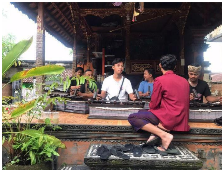
Gambar 3 melatih gending tabuh Gamelan Selonding (Dok I Dewa Ketut Manik Kedaton Juni 2023)