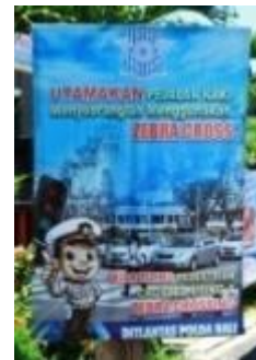
Gambar 7. Media Stand Banner 2