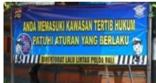
Gambar 4. Media Banner 2

Media ini direntangkan horisontal terdapat teks dengan judul anda memasuki kawasan tertib hukum patuhi aturan yang berlaku, dengan ukuran tipografi yang besar berwarna kuning serta stroke hitam sehingga mempertegas pesan yang disampaikan berupa seruan bahwa kita memasuki sebuah kawasan tertib hukum dan ditekankan untuk mematuhi aturan yang berlaku. Slogan yang ditampilkan melalui semacam balon kata yang diucapkan oleh ikon sebagai seruan untuk mengikuti kalimat slogan berupa “ Jadilah Pelopor Keselamatan Berlalu lintas dan Budayakan Keselamatan Sebagai Kebutuhan” dan kalimat penutup Direktorat lalu Lintas polda Bali. Ilustrasi yang dipakai berupa kartun yang menjadi ikon dari media pembelajaran dengan karakter polisi anak - anak yang diulang dua kali serta terdapat logo Polda Bali sebagai simbol resmi institusi sehingga media ini merupakan perwakilan resmi dari Polda Bali. Tipografi menggunakan jenis huruf san serif yang berkesan tegas. Penggunaan warna biru sebagai warna latar, warna kuning, putih dan merah digunakan pada teks. Lokasi penayangan media ada di jalan WR Supratman di depan Polda Bali.