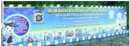
Gambar 3. Media Banner 1

Media ini direntang kan secara horisontal terdapat teks dengan judul Dalam Rangka Menekan Angka Kecelakaan Lalu lintas yang dalam penulisannya terdapat kesalahan pada kata lalu lintas yang ditulis lau lintas berisikan ilustrasi kartun yang menjadi ikon dari media pembelajaran dengan karakter polisi anak anak yang berisikan slogan “ Jadilah Pelopor Keselamatan Berlalu lintas dan Budayakan Keselamatan Sebagai Kebutuhan”. Beberapa kartun lain dengan tema seruan tentang jangan menggunakan hp saat berkendara, gunakan helm SNI, penggunaan plat kendaraan yang benar, juga terdapat logo Polda Bali dengan teks Polresta Denpasar dan logo Satlantas, hal ini menyatakan bahwa media ini merupakan perwakilan resmi dari