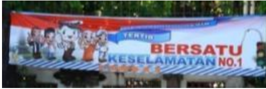
Gambar 5. Media Banner 3