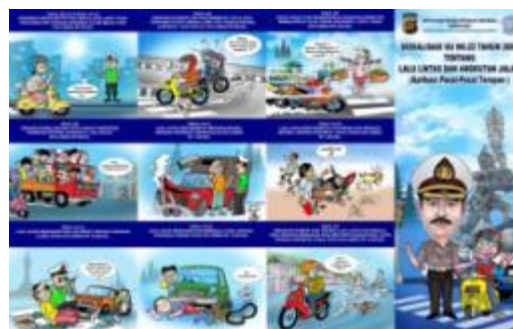
Gambar 1. Flyer sebagai media sosialisasi tentang lalu lintas dan angkutan jalan. Sumber : Bog-Bog Cartoon Magazine

Media komunikasi visual baik sebagai media promosi maupun kampanye menggunakan pendekatan berbagai gaya visual sesuai dengan target yang menjadi sasarannya. Dalam desain komunikasi visual kartun selain sebagai karya yang berdiri sendiri sebagai karya yang utuh dapat pula dipakai sebagai elemen visual berupa ilustrasi yang menjadi daya tarik yang khas pada media komunikasi visual.