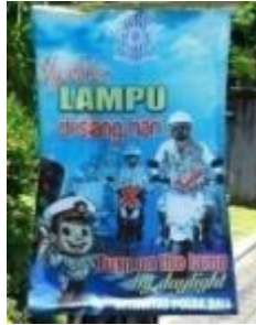
Gambar 8. Media Stand Banner 3

Banner ini direntangkan vertikal terdapat teks dengan kalimat nyalakan lampu di siang hari dan terjemahannya dalam bahasa Inggris turn on the lamp by daylight dengan kalimat penutup Ditlantas Polda Bali. Ilustrasi berupa gambar kartun yang menjadi ikon dari media pembelajaran dengan karakter polisi anak-anak dan berisikan ilustrasi fotografi menunjukkan pengguna sepeda motor menyalakan lampu di siang hari dengan karakter tokoh orang asing dengan tanda pilihan dan larangan berwarna merah yang diperkuat dengan stroke berwarna putih yang mewakili terlaksananya program menyalakan lampu di siang hari. Ilustrasi candi bentar bergaya Bali sebagai tanda bahwa program ini dilaksanakan di kawasan daerah Bali. Warna latar dominan menggunakan warna biru dan merah, kuning pada teks. Lokasi penayangan media berada di jalur selatan jalan WR Supratman.