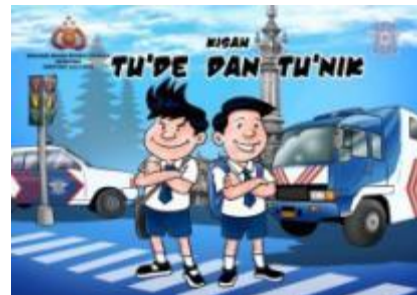
Gambar 10. Cover depan,