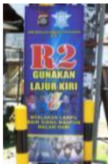
Gambar 6. Media Stand Banner 1