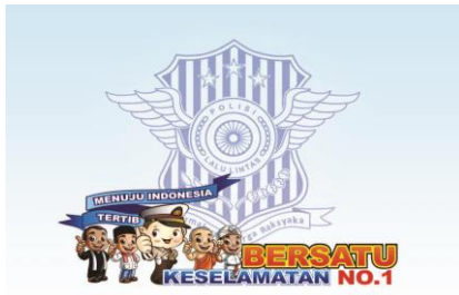
Gambar 11. Cover belakang