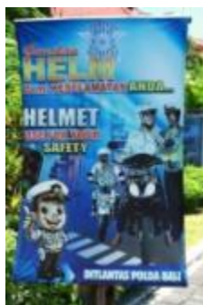
Gambar 9. Media Stand Banner 4

Pada media ini terdapat teks dengan kalimat gunakan helm demi keselamatan anda dan terjemahannya dalam bahasa Inggris helmet use for your safety dengan kalimat penutup Ditlantas Polda Bali menggunakan jenis huruf sans serif yang berkesan tegas. Ilustrasi berupa gambar kartun yang menjadi ikon dari media pembelajaran dengan karakter polisi anak-anak yang tersenyum lebar secara bersahabat mengarahkan sasaran untuk mengikuti program yang dikampanyekan dan berisikan ilustrasi fotografi menunjukkan pengguna sepeda motor dibantu seorang polwan yang dengan senyumnya menandakan keramahan membantu pengendara menggunakan helm, menyatakan bahwa kepolisian akan selalu memberikan pelayanannya yang terbaik. Warna latar dominan menggunakan warna biru dan merah, kuning serta putih pada teks untuk membangun kontras warna.