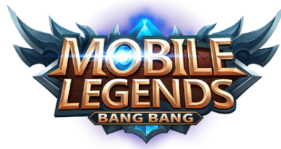
Gambar 8. Logo MLBB lama.