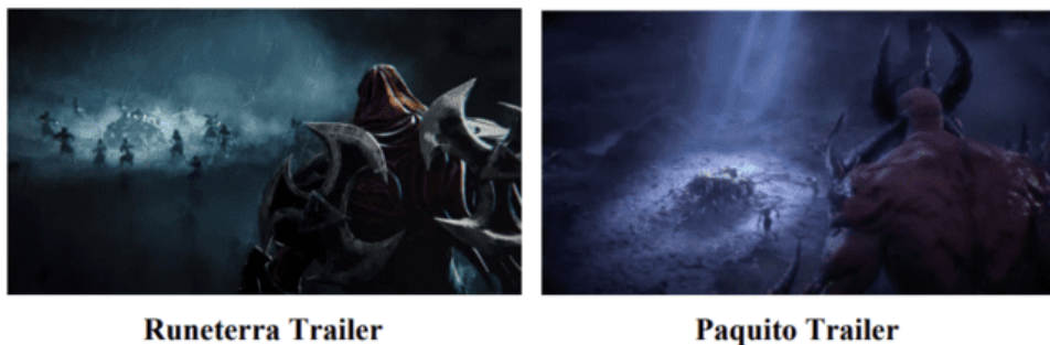
Gambar 4. Potongan dokumen yang berisi tentang plagiarisme trailer.

Selain visual dalam game, Montoon juga melakukan plagiarisme pada strategi marketing yang dilakukan oleh Riot. Salah satu event dalam game yang digarap oleh Riot terlihat secara blak-blak an ditiru oleh Montoon seperti pada salah satu event game dengan tema Pool Party oleh LoL dan Summer Splash oleh MLBB. Imitasi yang dilakukan Montoon bahkan sampai sejauh meniru bentuk kampanye Riot pada Oktober 2020, Riot mengkustom sepatu Nike untuk mempromosikan Wild Rift, Lalu pada Maret 2021, Moontoh membuat sepatu Nike custom dengan font emas yang sama.