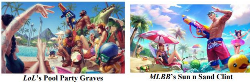
Gambar 14. Ilustrasi pada event musim panas

Di sebuah event yang diadakan didalam game, LoL mengadakan event bertemakan “ Pool Party ” dengan meluncurkan skin karakter yang menggunakan atribut musim panas, seperti pelampung, kolam renang, bola pantai, tembakan air, dan lain sebagainya. Hal ini kemudian di tiru kembali oleh MLBB dengan meluncurkan event yang sangat mirip. Mulai dari skin karakter yang diluncurkan, atribut game yang digunakan, hingga ilustrasi yang menjadi bahan marketing pun terlihat serupa.