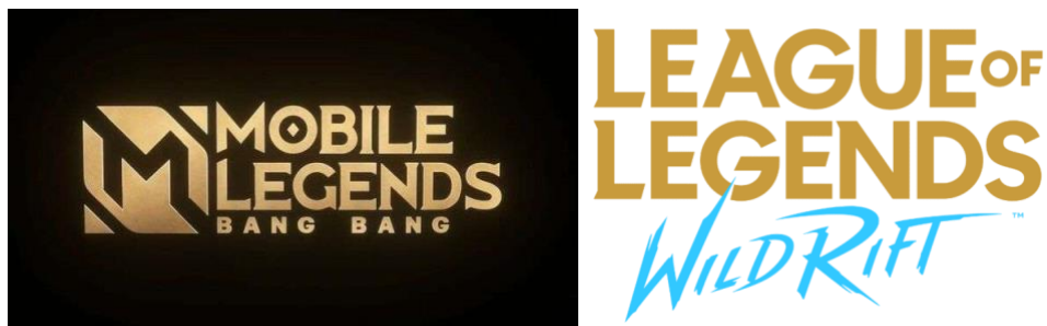
Gambar 9. Logo MLBB dan LoL : Wild Rift.