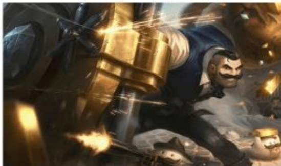
Wild Rift's Braum

Lalu kasus lain serupa dengan karakter Leona (LoL) dan Irithel (MLBB), keduanya memiliki tema dan warna yang mirip. Dengan gaya pakaian armor modern dengan aksesoris kuning dibagian dada dan helm yang memiliki telinga dengan desain seperti antena, kedua kostum ini terlihat serupa secara konsep.