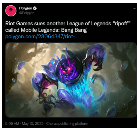
Gambar 1. Postingan Twitter Polygon yang menyisipkan dokumen gugatan Riot

Gugatan yang dilakukan oleh Riot Games kepada Montoon berupa dokumen yang di unggah oleh akun twitter Polygon berisikan poin-poin yang telah di plagiarisme oleh pihak Montoon kepada Riot atas game MLBB yang memplagiat LoL