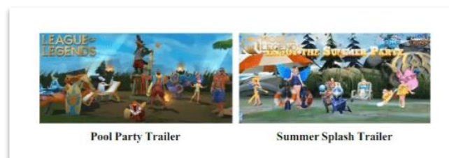
Gambar 5. Event yang ditiru secara blak-blak an oleh MLBB.

Selain visual dalam game, Montoon juga melakukan plagiarisme pada strategi marketing yang dilakukan oleh Riot. Salah satu event dalam game yang digarap oleh Riot terlihat secara blak-blak an ditiru oleh Montoon seperti pada salah satu event game dengan tema Pool Party oleh LoL dan Summer Splash oleh MLBB. Imitasi yang dilakukan Montoon bahkan sampai sejauh meniru bentuk kampanye Riot pada Oktober 2020, Riot mengkustom sepatu Nike untuk mempromosikan Wild Rift, Lalu pada Maret 2021, Moontoh membuat sepatu Nike custom dengan font emas yang sama.