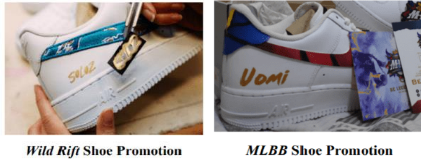
Gambar 6. Imitasi sepatu oleh Montoon yang meniru karya Riot.

Kerugian yang dirasakan bagi Riot adalah bentuk keuntungan yang diraup oleh Montoon yang dengan sadar melakukan pelanggaran dan mencuri keuntungan komersil tanpa membayar kreativitas marketing Riot sehingga menghilangkan value dan originalitas pada konten original Riot. Dalam gugatannya Riot menyatakan untuk klaim tentang kebebasan alegasi sebagaimana dinyatakan dalam dokumen dan bukti yang telah dilampirkan :