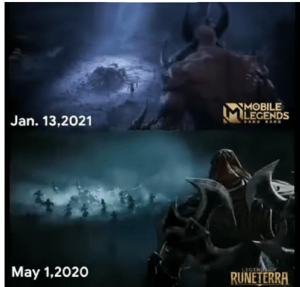
Gambar 16. Salah satu potongan trailer MLBB dan LoL.