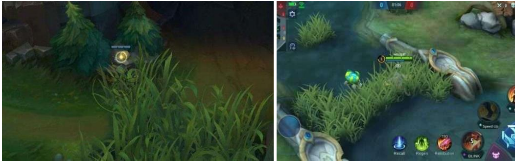
Gambar 11. Bush MLBB dan LoL.