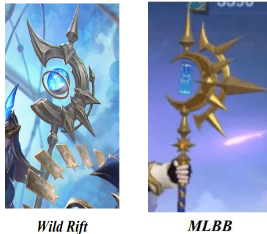
Gambar 3. Potongan dokumen yang berisi tentang plagiarisme elemen.