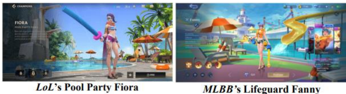
Gambar 15. Jagoan Fiora (LoL) dan Fanny (MLBB).