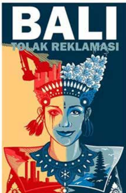
Gambar 7. Susunan susunan bidang dari ilustrasi penari Legong pada media komunikasi visual gerakan Bali tolak reklamasi teluk Benoa

wi”, dimana sang desainer menyampaikan kondisi pulau Bali saat ini, bagaimana wajah Ibu Pertiwi (pulau Bali) kini telah mengalami perubahan, yang awalnya begitu tenang, asri dengan kesakralan dan kebudayaan dan adat tradisi yang diakui di seluruh dunia, hal ini ditunjukkan dengan penggunaan bidang tumpang meru (tempat suci umat Hindu), burung – burung yang beterbangan dan sebagian ilustrasi penari legong yang tidak mengalami perubahan bentuk ilustrasi. Namun perubahan wajah pulau Bali yang membuat Ibu Pertiwi sampai menangis darah, ini diakibatkan karena terjadinya eksploitasi pariwisata dan kerakusan investor yang melakukan segala cara untuk kepentingan pribadi dan golongannya tanpa melihat dampak yang dapat ditimbulkan, dimana salah satunya dengan merencanakan suatu upaya reklamasi di teluk Benoa, makna ini jelas terlihat pada ilustrasi hiasan kepala penari legong yang berupa ilustrasi gedung – gedung pencakar langit, pabrik dan pengerusakan alam Bali yang diwakili oleh ilustrasi alat berat. Dimana bidang - bidang tersebut terdapat pada sisi kiri dari ilustrasi penari legong tersebut.