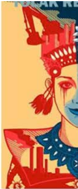
Gambar 5. Susunan warna yang terdapat pada sisi kiri dari ilustrasi penari Legong pada media komunikasi visual gerakan Bali tolak reklamasi teluk Benoa

Berdasarkan makna negatif dari warna yang dipaparkan diatas, maka penulis dapat mengkaji bahwa ada niat dari sang desainer untuk menyampaikan pesan bahwa ada pihak yang memiliki sigat agresif dan arogan yang ingin bertidak brutal dan akan membahayakan pulau Bali ke depan.