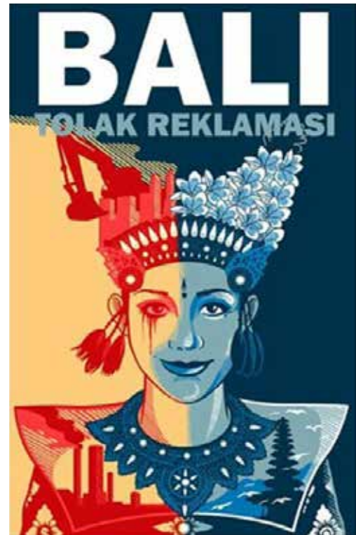
Gambar 4. Unsur gelap-terang yang terdapat dari ilustrasi penari Legong pada media komunikasi visual gerakan Bali tolak reklamasi teluk Benoa

Seorang desainer tentu dalam merancang suatu komunikasi visual akan merencanakan dengan matang