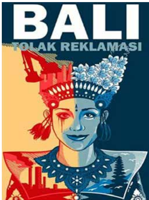
Gambar 3. Bidang dari Ilustrasi penari Legong pada media komunikasi visual gerakan Bali tolak reklamasi teluk Benoa

Segala bentuk apa pun yang memiliki dimensi tinggi dan lebar disebut dengan bidang (Supriyono, 2010; 66), perancangan suatu bidang dengan bentuk tertentu sangat diperlukan dalam merancang sebuah ilustrasi, agar ilustrasi tersebut memiliki makna yang kuat. Dalam ilustrasi penari Legong pada gerakan Bali tolak reklamasi teluk Benoa, terdapat beberapa bidang yang membentuk suatu ilustrasi tertentu, gedung, alat berat, pabrik, Pura, burung, serta bidang lainnya yang membentuk suatu ilustrasi tertentu.