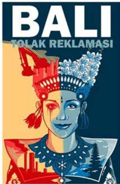
Gambar 8. Ukuran desain dari ilustrasi penari Legong pada media komunikasi visual gerakan Bali tolak reklamasi teluk Benoa

dimana makna denotatif bersifat langsung, dan dapat disebut sebagai gambaran dari suatu petanda. Sedangkan makna konotatif akan sedikit berbeda dan akan dihubungkan dengan kebudayaan yang tersirat dan makna yang terkandung di dalamnya (Berger, 2010; 65).