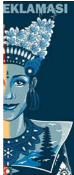
Gambar 6. Susunan warna yang terdapat pada sisi kanan dari ilustrasi penari Legong pada media komunikasi visual gerakan Bali tolak reklamasi teluk Benoa

upaya yang merusak kedamaian dan ketenangan pulau Bali.