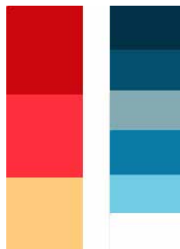
Gambar 1. Warna yang digunakan pada Ilustrasi penari Legong.

Sehingga terdapat dua sisi warna kontras yang saling bersebrangan antara sisi kanan dan sisi kiri dari ilustrasi penari Legong tersebut.