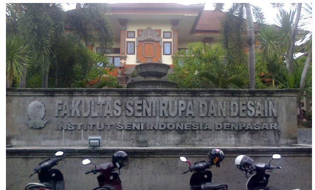
Gambar 3. Papan nama FSRD ISI Denpasar dilihat dari jarak tertentu

Ukuran huruf terkecil yang harus ada pada papan nama Fakultas Seni Rupa dan Desain adalah, tinggi 90 cm, lebar 60 cm, dan tebal 15 cm. Jadi yang tidak memenuhi syarat adalah huruf pada tulisan "fakultas seni rupa dan desain", sehingga harus diperbaiki sesuai dengan hasil penghitungan dengan rumus.