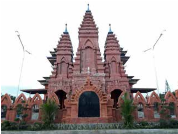
Gambar 3: Gereja Katolik Roh Kudus Katedral Denpasar terletak di jalan Tukad Musi No 1, Kelurahan Renon, Denpasar.