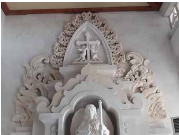
Gambar 7: Unsur warna pada plafon gypsum di area pintu masuk utama.