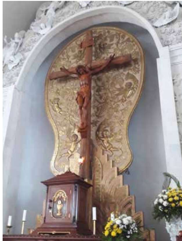
Gambar 8: Unsur warna pada plafon gypsum di area pintu masuk utama.