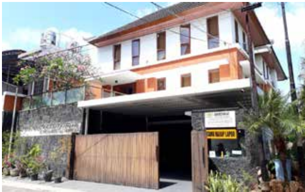
Gambar 2: Sekretariat Gereja Katedral Denpasar di jalan Tukad Musi 1 No 1, Renon, Denpasar.