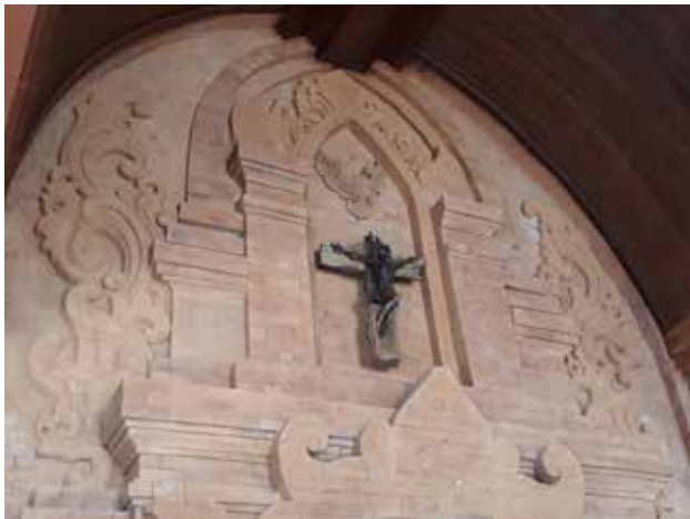
Gambar 6: Ornamen Bali seperti karang goak dan patra punggel dari bahan bata merah serta hiasan salib dan burung merpati dengan warna senada merah bata di atas pintu masuk utama Gereja. Unsur warna pada plafon gypsum di area pintu masuk utama. Sumber: dokumentasi penulis, 2016.

warna. Merah, biru, dan warna-warna hijau atau jingga merupakan warna dasar dipulas dengan warna kuning emas perada atau perada gede Pepulasan perada kuning emas atau cat emas disebut perada gede pada kain umumnya digunakan untuk tirai-tirai ruang yang disebut langse atau kain-kain hiasan ider-ider tepi atap bangunan, pembungkus tiang, tepi kasur atau leluwur sebagai langit-langit. Pepulasan perada juga dipakai pada kain-kain mahkota penari tarian tradisional, warna pepulasan pada patung-patung dan lainnya (Ngakan, 2008: 178).