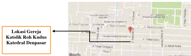
Gambar 1: Denah lokasi Gereja Katolik Roh Kudus Katedral Denpasar.