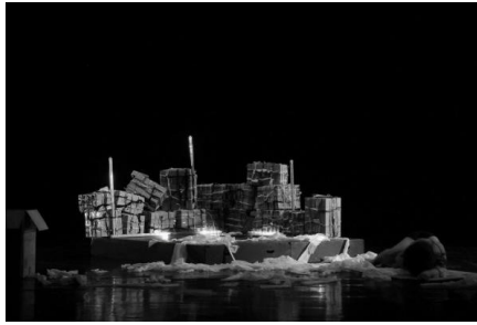
Gambar 4: Eksekusi tata rupa pentas, simbol keterbatasan ruang pada Kotak Waktu (foto: Ody, Agustus 2020)

Rias dan Busana: disainnya sederhana hanya menggunakan celana pendek hitam dan kaos tank top hitam yang menggambarkan situasi di rumah.