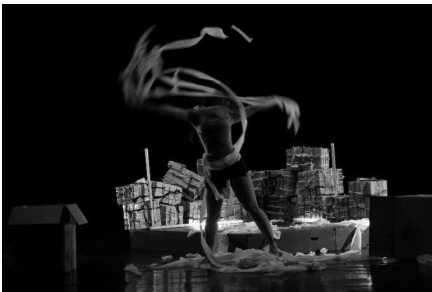
Gambar 6: Penari Kotak Waktu menggerakkan tisu yang di tubuhnya menciptakan disain tertunda (foto: Ody, Agustus 2020)