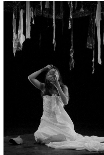
Gambar 8: Penari Mimpi di Atas Impian saat tampil tanpa lembaran kain (gambar kiri) dan saat bagian ending tubuhnya dibalut kain putih, mengenakan topeng dan masker (foto: Ody, Agustus 2020)