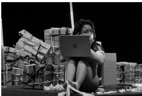
Gambar 7: Penari Kotak Waktu mengenakan masker dan memegang laptop (foto: Ody, Agustus 2020)