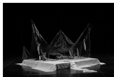
Gambar 2: Eksekusi tata rupa pentas, ymbol kamar wanita pada koreografi Mimpi Di atas Impian

Trap kayu ukuran 240 cm x 240 cm tinggi 20cm Kain lembaran berbahan lembut warna putih Paraneet, ayaman tali raffia warna hitam yang biasa digunakan untuk peneduh tanaman.