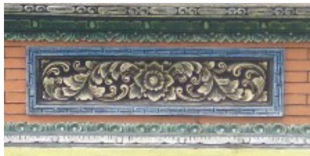
Gambar 9. Ornamen flora pada plang nama SMPN 1 Belitang III

desa di OKU Timur didiami oleh masyarakat Bali yang masih menjaga dengan sangat baik adat budaya asli mereka. Jarak desa Nusa Bali dengan desa Nusa Bakti lebih tepatnya ke SMP Negeri 1 Belitang III sendiri hanya berjarak 2.1KM. dengan jarak tempuh menggunakan roda empat hanya 6 menit saja. Merupakan jarak yang begitu dekat.