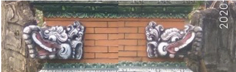
Gambar 8. Ornamen karang gajah