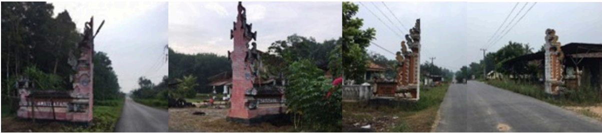
Gambar 1, 2, 3 dan 4. Tugu selamat datang desa Nusa Bali dan Nusa Agung

setempat di SMP Negeri 1 Belintang III. Dengan bahan bangunan dibeli langsung dari toko bangunan yang menyediakan perlengkapan bangunan bernuansa Bali. Sebagai bahan pertimbangan dari efisiensi waktu dan biaya sehingga diputuskan untuk membeli desain ornamen dengan motif Bali yang langsung pasang sehingga dapat mempercepat pembangunan dan ditinjau dari segi biaya juga relatif murah. Bahan bangunan sendiri didatangkan dari desa Pemetung Basuki kecamatan Buay Pemuka Peliung Kabupaten OKU Timur Sumatera Selatan. Desa Pemetung Basuki merupakan desa Bali yang jaraknya 49 KM dari SMP Negeri 1 Belintang III.