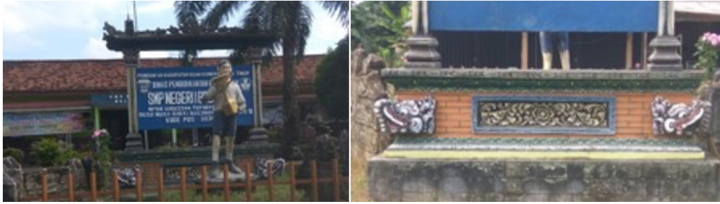
Gambar 6 dan 7. Plang Sekolah SMPN 1 Belitang III