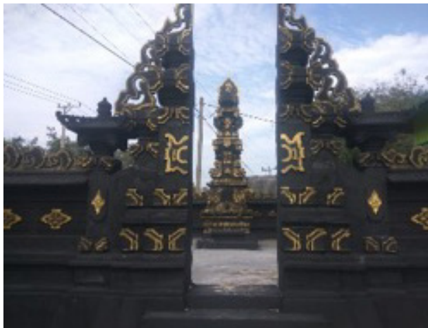
Gambar 5. Pura Padmasana SMPN 1 Belitang III

dengan murid-murid sebagian besar adalah orang Bali.