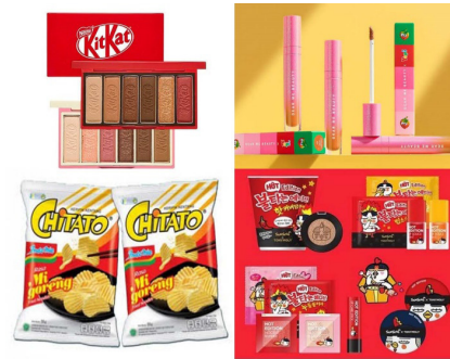
Gambar 1. Contoh Kolaborasi Antar Brand

Di era New Wave saat ini, masyarakat menilai sebuah produk lebih dari sekedar fungsi, yakni karena adanya hubungan emosi dengan suatu produk. Dengan memanfaatkan sisi emosional dari satu produk, produk yang lain