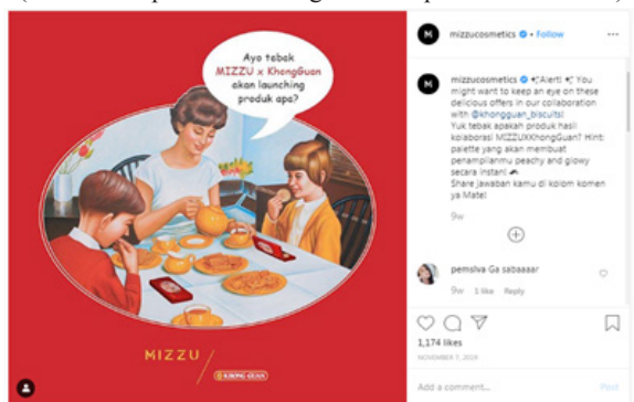
Gambar 8. Kampanye “#MIZZUCariPapa” Dari Mizzu Cosmetics