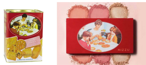
Gambar 2. Desain Kemasan Khong Guan (kiri) dan Mizzu Face Palette x Khong Guan (kanan)

bisa mendapatkan keuntungan dalam hal pemasarannya. Faktor emosi ikut berkontribusi dalam pengambilan keputusan yang dilakukan oleh konsumen terhadap suatu produk. Hal ini cukup berbeda dengan pemikiran kuno yang memandang aspek kognitif lebih berperan dibandingkan aspek emosi dalam pengambilan keputusan. Pengambilan keputusan terdiri tidak hanya melibatkan peran kognitif saja namun merupakan gabungan antara emosi dan kognitif (Norman, 2004:12). Berdasarkan penelitian pasar ( market research ) juga menunjukkan sangat sedikitnya konsumen yang membuat keputusan murni berdasarkan fungsi dari suatu produk (Roberts,2004:21). Strategi pemasaran yang memanfaatkan emotional branding dengan adanya kolaborasi Mizzu Cosmetics x Khong Guan ini merupakan hal yang inovatif dan penting untuk diteliti sebagai pilihan produsen dalam memenangkan persaingan pasar. Menurut Chandra (Chandra, 2002:93), strategi pemasaran adalah penjabaran rencana tentang ekspektasi perusahaan akan dampak beragamnya aktivitas atau program pemasaran terhadap permintaan produk atau lini produknya di pasar sasaran tertentu. Program pemasaran meliputi tindakan-tindakan pemasaran yang dapat mempengaruhi permintaan terhadap produk, diantaranya dalam hal mengubah harga, memodifikasi kampanye iklan, merancang promosi khusus, menentukan pilihan saluran distribusi, dan sebagainya.