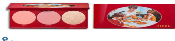
Gambar 4. Desain Kemasan Khong Guan ukuran kaleng besar dan kecil

dilakukan untuk memaparkan fakta-fakta terhadap fenomena strategi pemasaran kolaborasi yang dilakukan oleh objek penelitian yaitu produk “Khong Guan Face Palette” dari Mizzu Cosmetics.