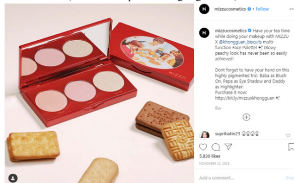
Gambar 10. “Khong Guan Face Palette” Dari Mizzu Cosmetics