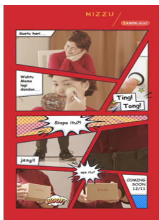
Gambar 7. Kampanye dalam fitur “story” Dari Mizzu Cosmetics