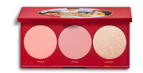
Gambar 9. Nama-nama warna dari Mizzu Cosmetics “Khong Guan Palette”

Kampanye tersebut dilakukan hingga menjelang peluncuran produk “Khong Guan Face Palette” pada unggahan tanggal 7 November 2019. Unggahan tersebut sudah menampilkan sedikit ilustrasi dari produk, namun belum tampak keseluruhan. Hal ini dilakukan untuk menjaga rasa penasaran dari konsumen yang belum pasti mengetahui rilisan produk tersebut. Disini aspek emotional branding ditingkatkan dengan tambahan visual dari ilustrasi produk yang memancing panca indera dan meningkatkan rasa penasaran. Dalam unggahan tersebut ilustrasi keluarga Khong Guan tidak hanya terlihat menyantap biskuit saja, namun juga dapat terlihat produk kosmetik. Pendekatan imajinatif yang kreatif dalam unggahan ini meningkatkan rasa penasaran terhadap wujud dari produk kolaborasi dan engagement para pengikut dari akun media sosial @miz-