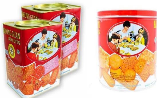
Gambar 3. Desain Kemasan Khong Guan ukuran kaleng besar dan kecil