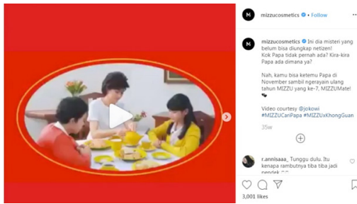
Gambar 5. Kampanye “#MIZZUCariPapa” dari Mizzu Cosmetics