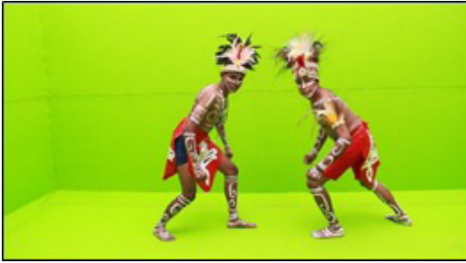
Gambar 1. Penari Karwar laki-laki (Papua)