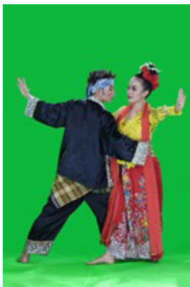
Gambar 3. Tari Cikeruhan berpasangan (Sunda) Dokumentasi: Tim Peneliti KRUPPT 2019.

Patung Mbitoro dari Suku Kamoro dan Patung Doreri Uno yang kini tengah menghadapi kepunahan karena krisis regenerasi. Masing-masing patung tersebut memiliki wujud figur dan makna filosofi khas serta dihormati dalam kebudayaan lokal masyarakat masing-masing wilayah. Namun satu hal yang memiliki kemiripan, ialah patung-patung tersebut sama-sama menggambarkan konsep penghubung kehidupan dan kematian.