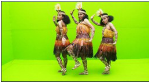
Gambar 2. Penari Karwar perempuan (Papua)