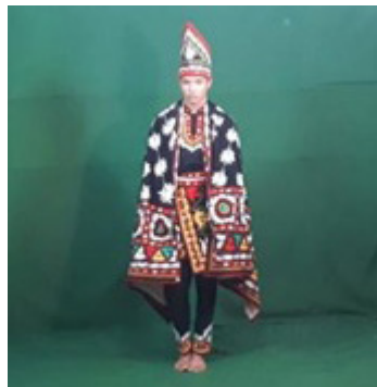
Gambar 6. Penari Guel (Aceh)

Reality (AR) Pasua PA merupakan proses kreatif seni pertunjukan dengan mendigitalisasikan karya seni Pasua, berdasarkan pandangan Murgiyanto bahwa memelihara tradisi bukanlah sekedar memelihara bentuk tetapi lebih pada jiwa dan semangat atau nilai-nilai, maka kita akan dengan lebih leluasa bisa melakukan interpretasi dan menciptakan kembali, sekaligus kita juga akan mewarisi sikap kreatif dan imajinasi yang subur sebagaimana dimiliki nenek moyang kita yang telah berhasil menciptakan karya-karya besar di masa lampau. Dengan demikian, kita akan selalu dapat menyelaraskan semangat kesenian tradisi dengan perkembangan kehidupan masyarakat pada masa sekarang (2004:16).