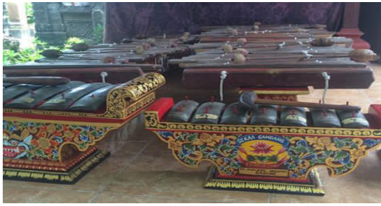
Gambar 1. Gamelan Gambang (Dokumentasi I Putu Gede Wahyu Kumara Putra)

peristiwa-peristiwa yang terjadi di lapangan sesuai dengan keadaan yang sebenarnya.