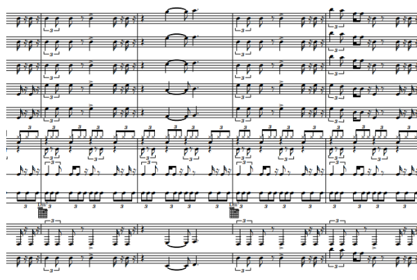
Gambar 3 Quintet Saxophone

Lebih lanjut, pola takitu juga ditransformasikan ke dalam permainan quintet saxophone, yang menunjukkan adanya perluasan dari ranah perkusi menuju wilayah melodis dan harmonis. Transformasi ini menegaskan bahwa rekonstruksi bunyi tidak hanya terjadi pada tingkat ritmis, tetapi juga pada distribusi fungsi musikal. Dengan demikian, sistem bunyi gendang yakni pola takitu dalam komposisi musik Barong Wae tidak lagi hadir sebagai bentuk yang tetap, melainkan sebagai sistem yang fleksibel, yang dapat direorganisasi tanpa sepenuhnya kehilangan identitas asalnya.