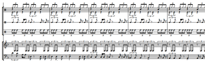
Gambar 2 Rhythm Section

Meskipun terjadi perluasan medium, gendang tetap menjadi pusat orientasi ritmis dalam komposisi. Hal ini tampak pada pola bass yang mengikuti struktur takitu , sehingga mempertahankan fondasi ritmis dari pola ritmis takitu . Di sisi lain, gitar dengan penggunaan efek distorsi serta pola ritmis repetitif membangun tekstur bunyi yang memperkuat karakter musikal secara keseluruhan. Selain itu, penggunaan fill in yang diadaptasi dari praktik musikal Manggarai berfungsi sebagai penanda transisi, yang dalam konteks komposisi mengalami pergeseran dari fungsi ritual menjadi elemen pengembangan musikal.