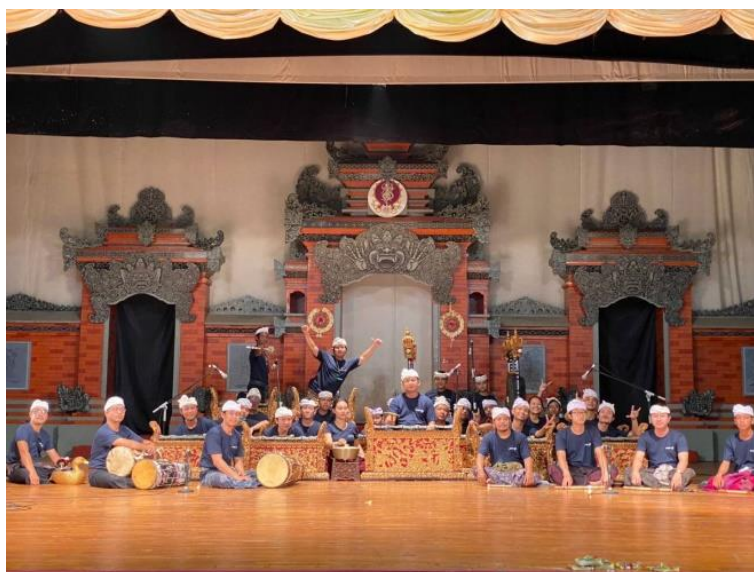
Gambar 3 Gladi bersih

Hasil dari semua proses adalah pementasan yang diselenggarakan pada 11 Januari 2022 bertempat di kampus Institut Seni Indonesia Denpasar tepatnya di panggung gedung Natya Mandala. Pada hasil ini yang disiapkan oleh penata adalah pakaian penabuh/pendukung karya musik seni karawitan yang disewa pada Adianom Costume dan pakaian penata yang disewa pada Bali Clasik Wedding, Transportasi, Konsumsi, Sarana dan Prasana, properti seperti ( dulang , tapel Barong Ket, dan “ Sekar Taji ”), serta lighting dan sound system agar pementasan lebih estetik.