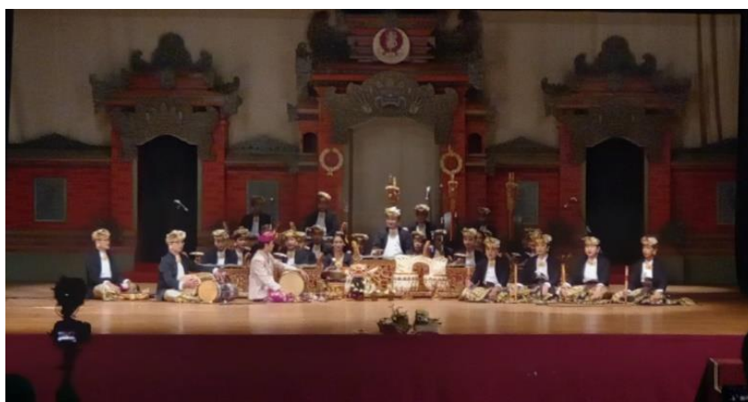
Gambar 4. Pementasan Karya Seni Karawitan Tabuh Kreasi “ Sekar Taji ”

Hasil dari semua proses adalah pementasan yang diselenggarakan pada 11 Januari 2022 bertempat di kampus Institut Seni Indonesia Denpasar tepatnya di panggung gedung Natya Mandala. Pada hasil ini yang disiapkan oleh penata adalah pakaian penabuh/pendukung karya musik seni karawitan yang disewa pada Adianom Costume dan pakaian penata yang disewa pada Bali Clasik Wedding, Transportasi, Konsumsi, Sarana dan Prasana, properti seperti ( dulang , tapel Barong Ket, dan “ Sekar Taji ”), serta lighting dan sound system agar pementasan lebih estetik.