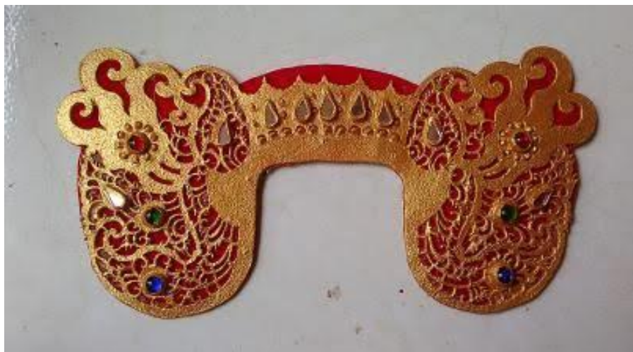
Gambar 1 Sekar Taji

Pagulingan Saih Pitu, dan gending-gending barungan gamelan Gong Kebyar yang memiliki struktur atau bentuk yang berbeda meskipun ukuran tabuhnya hampir sama seperti contoh tabuh yang berbentuk tradisi maupun tabuh yang berbentuk kreasi baru. Kata tabuh juga mempunyai pengertian gending seperti misalnya tabuh kekunaan artinya gending kekunaan , tabuh kreasi baru yang berarti gending kreasi baru (Sukerta, 2009). Kreasi baru biasanya diistilahkan oleh penabuh ataupun masyarakat Bali untuk menyebutkan salah satu bentuk gending-gending pategak pada barungan gamelan Gong Kebyar. Istilah ini digunakan untuk membedakan jenis gending-gending tabuh petegak lainnya, misalnya gending-gending tabuh petegak Pakebyaran, tabuh petegak Pepanggulan, dan tabuh petegak iringan tari. Dari jumlah tabuh petegak kreasi baru yang ada dapat mengambil suatu kesimpulan bahwa dalam gending-gending tabuh petegak kreasi baru ada empat bagian (Sukerta, 2009) Sajiannya membawa perkembangan musikal Tabuh Kreasi Baru ke arah yang lebih kompleks dari sebelumnya (Adi, 2020). Tabuh kreasi baru biasanya menggunakan ide atau konsep dari fenomena alam, pengamatan maupun pengalaman pribadi seperti yang dialami penata saat membuat suatu pepayasan atau ukiran dalam sebuah Barong Ket.