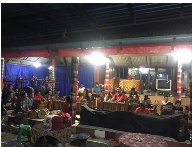
Gambar 2 Proses Latihan

karawitan Bali, selanjutnya penata melakukan eksplorasi terhadap gamelan Gong Kebyar sebagai media ungkap. Penata juga mendengarkan beberapa karya tabuh kreasi baik berupa rekaman video maupun rekaman Mp3, setelah mendengarkan penata mencoba menuangkan kedalam media FL studio dan mencatatnya ke dalam bentuk notasi. Penata juga melakukan pertemuan dengan ketua sanggar untuk melakukan tahap pembentukan karya, pertemuan awal dengan pendukung karya musik seni karawitan, dilakukan proses “Nuasen” dalam istilah Bali, karena Bali khususnya percaya dengan yang disebut mistis yaitu Sekala dan Niskala, proses ini dilakukan agar timbul kenyamanan saat berproses serta dapat mempersatukan rasa dalam memainkan atau membawakan suatu karya seni.